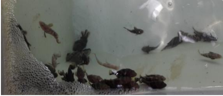
图3 患病鱼苗沉底、体色发黑