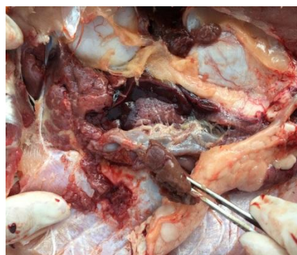
图 4 肝脾肿大