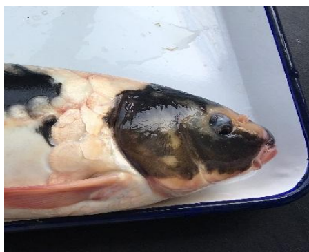
图 3 眼球凹陷