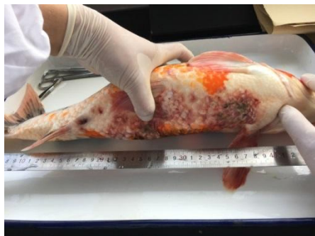
图 2 病鱼体表