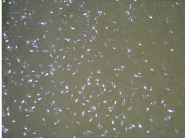
图2 患病苗种鳔胀气，漂浮水面