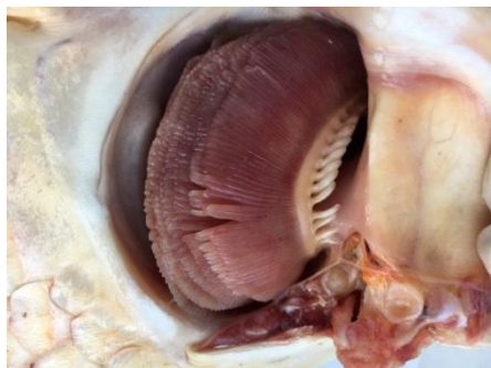
图 1 病鱼鳃组织

丝发白褪色，肛门红肿，全身体表多处出血，尤其是鳍条基部严重出血；剖检后可见病鱼脾脏、肾脏明显肿大、肝脏易碎。